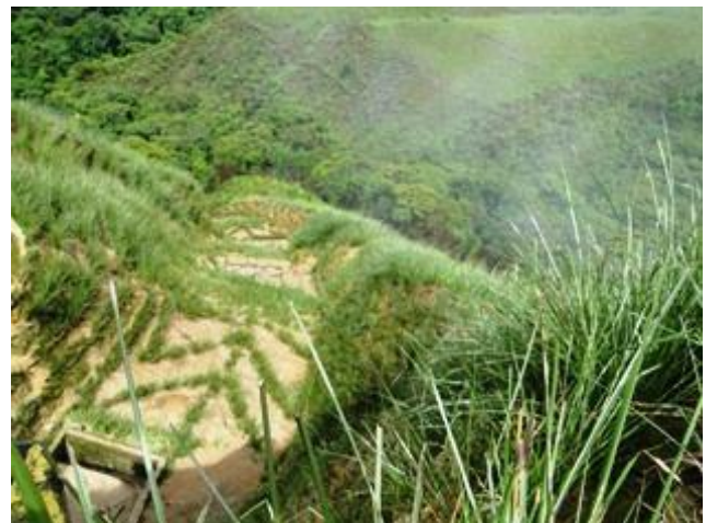
Figuras 12 y 13.- Cárcava en vías de estabilización, vistas izquierda y derecha (May 2.010)