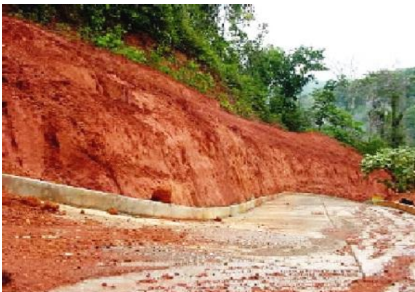
Figura 4.- Talud antes del tratamiento con vetiver (Oct 2.003)

Mediante la siembra de vetiver en curvas de nivel, se conformaron barreras que estabilizaron taludes de corte con pendientes que van desde los 30° hasta los 80° de inclinación. Las imágenes muestran un talud de pendientes múltiples estabilizado en el 2.004, antes y el después de la aplicación del SV. Además de controlar la erosión, la siembra del vetiver tuvo aquí como propósito propiciar la recuperación del bosque originario. A la fecha se observa se han propagado en el talud unas 12 especies diferentes sin participación antrópica. A medida que el bosque reaparece la sombra de las nuevas plantas limita el crecimiento del vetiver, en razón de lo cual este desaparece progresivamente para dar paso a la flora silvestre. La estabilización del sitio es total tras 7 años de la intervención.