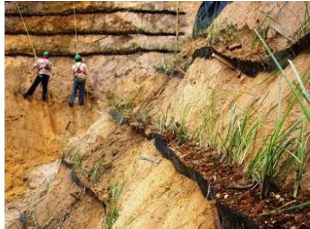
Figura 11.- Un talud terminado y el otro en proceso (Oct 2.009)

Esta obra fue ejecutada a finales del 2009, por lo que las plantas atravesaron su período de adaptación en plena temporada seca del año 2010. Durante dicho período, el bajo nivel de los embalses y la presencia del fenómeno de el niño motivaron los mayores racionamientos de agua y electricidad que ha enfrentado el país en las últimas décadas; por lo que la frecuencia de los riegos fue significativamente inferior a la prevista. En razón de ello, además de las enmiendas químicas de rigor se aplicaron hormonas y esteroides para promover el crecimiento de las plantas.