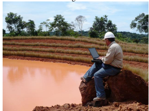
Figura 7.- Laguna protegida con vetiver (Jun 2.005)