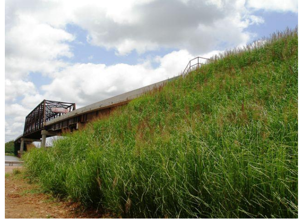
Figura 4.- mismo talud estabilizado con Vetiver (Junio 2008)