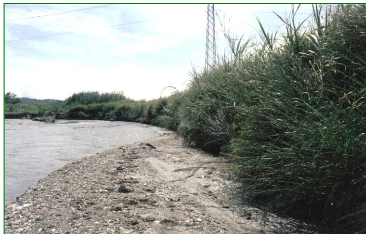
Figura 2.- Acumulación de Sedimentos en la orilla que antes erosionaba Río Turbio, cerca de Yaritagua, Edo. Yaracuy.

A seis meses de la siembra, el vetiver tenía en promedio 1,5 m de altura y las raíces habían estabilizado el terreno. En diciembre, a 10 meses post-siembra, ocurrió una de las más fuertes crecidas durante años que desbordó el cauce del río en toda su trayectoria y originó serios daños en su ribera. Al retirarse las aguas se observó que la creciente no sólo no había afectado la zona protegida, sino que había aportado una cantidad considerable de sedimentos, dejando en su lecho un banco de arena de 3 m de ancho por 20 m de largo en la zona que otrora erosionaba y, que a futuro modificaría la dinámica del río en ese sector.