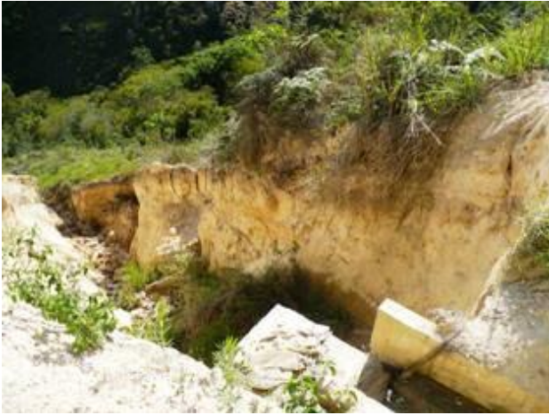
Figura 8.- Vista derecha de la Cárcava (Enero 2.009)

En una ladera adyacente a una vialidad rural del Estado Miranda, en terrenos cercanos a los manantiales de una empresa embotelladora de agua mineral, se encuentra una gran cárcava cuya alta tasa de erosión atacaba severamente al suelo, conllevando a la pérdida progresiva del mismo y poniendo en riesgo a la propia vialidad.