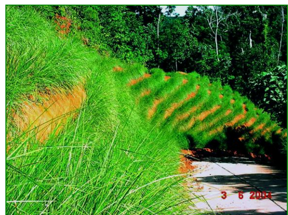
Figura 5 Talud ya estabilizado con vetiver (Jun 2.004)