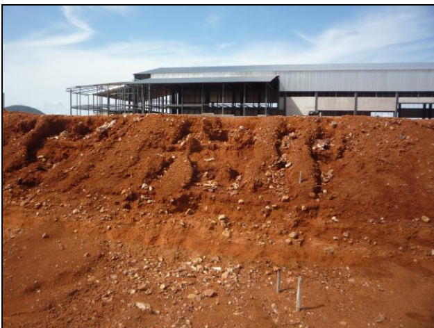
Figura 16.- Talud de una terraza afectada por la erosión (Ago 2.010)

La ejecución de la obra como tal no requirió de mayores aplicaciones técnicas, pero si de una coordinación logística bien supervisada dado lo distante de nuestra base (600 Kms) y la magnitud y corto plazo para su realización. La referencia de este trabajo propende a que los usuarios del SV puedan comparar ambos resultados (puentes Vs terrazas) y tomen sus propias decisiones.