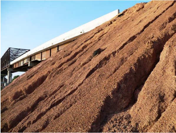
Figura 3.- Talud Sur del Puente Capanaparo antes de la siembra (Diciembre 2007)

A comienzos de agosto, mes en que las lluvias son más fuertes en la región, los taludes del terraplén carecían de surcos y cárcavas; el Sistema Vetiver ya los había estabilizado.