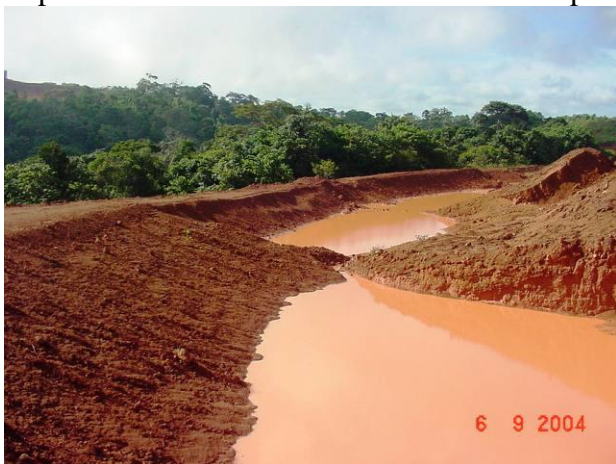
Figura 6.- Laguna de sedimentación antes de ser sembrada

El éxito obtenido con la aplicación del SV en las lagunas, llevo a la empresa operadora a implementar como norma el uso del vetiver para la protección de las nuevas lagunas.