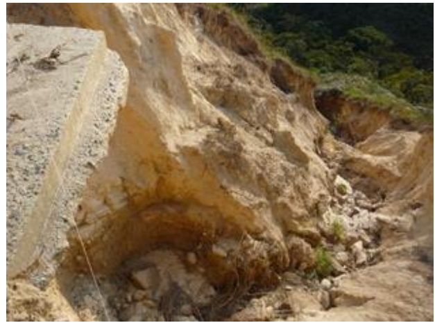
Figura 9.- Vista izquierda de la cárcava (Enero 2.009)*

Las precarias obras de drenaje de la vía, reconducen hacia el punto en que estas son vertidas sobre la ladera grandes volúmenes de agua. El agua reconducida, la constitución del suelo y la reciedumbre de las lluvias iniciaron procesos de erosión que, en 3 años de registro, llevaron la profundidad del punto de descarga de 5,8 a 10,2 m. Esto motivó la formación de una cárcava de grandes dimensiones.