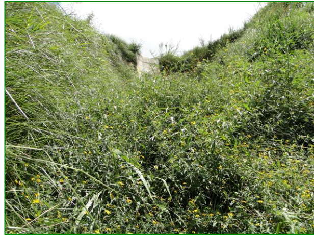
Figuras 14 y 15.- Cárcava completamente estabilizada, vistas izquierda y derecha (Dic 2.010)