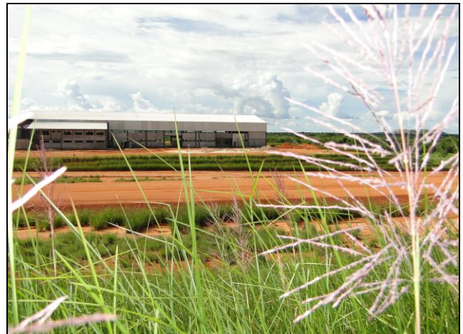
Figura 17 Terrazas y drenajes, luego de aplicado el SV (May 2.011)