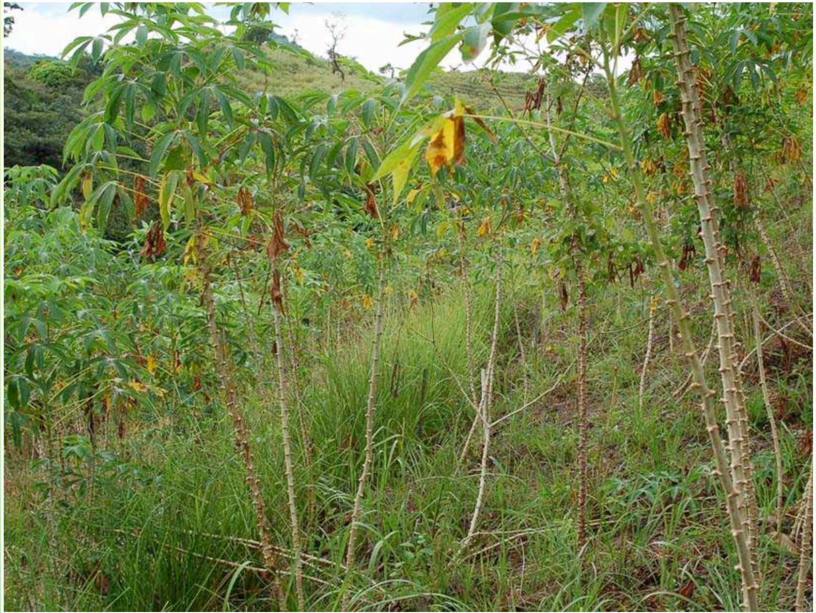
Barrera viva de vetiver en cultivo de yuca.