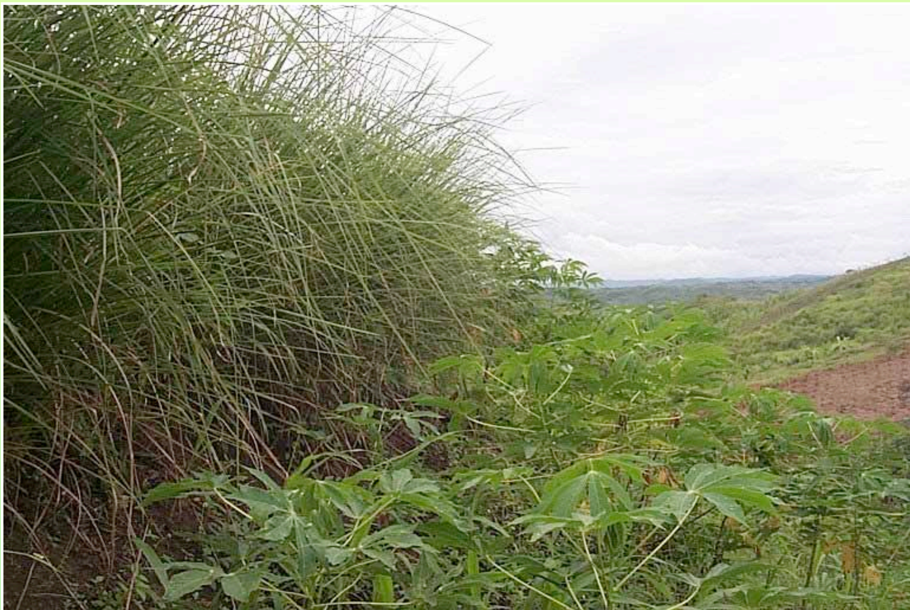
Barrera viva de vetiver en cultivo de yuca.