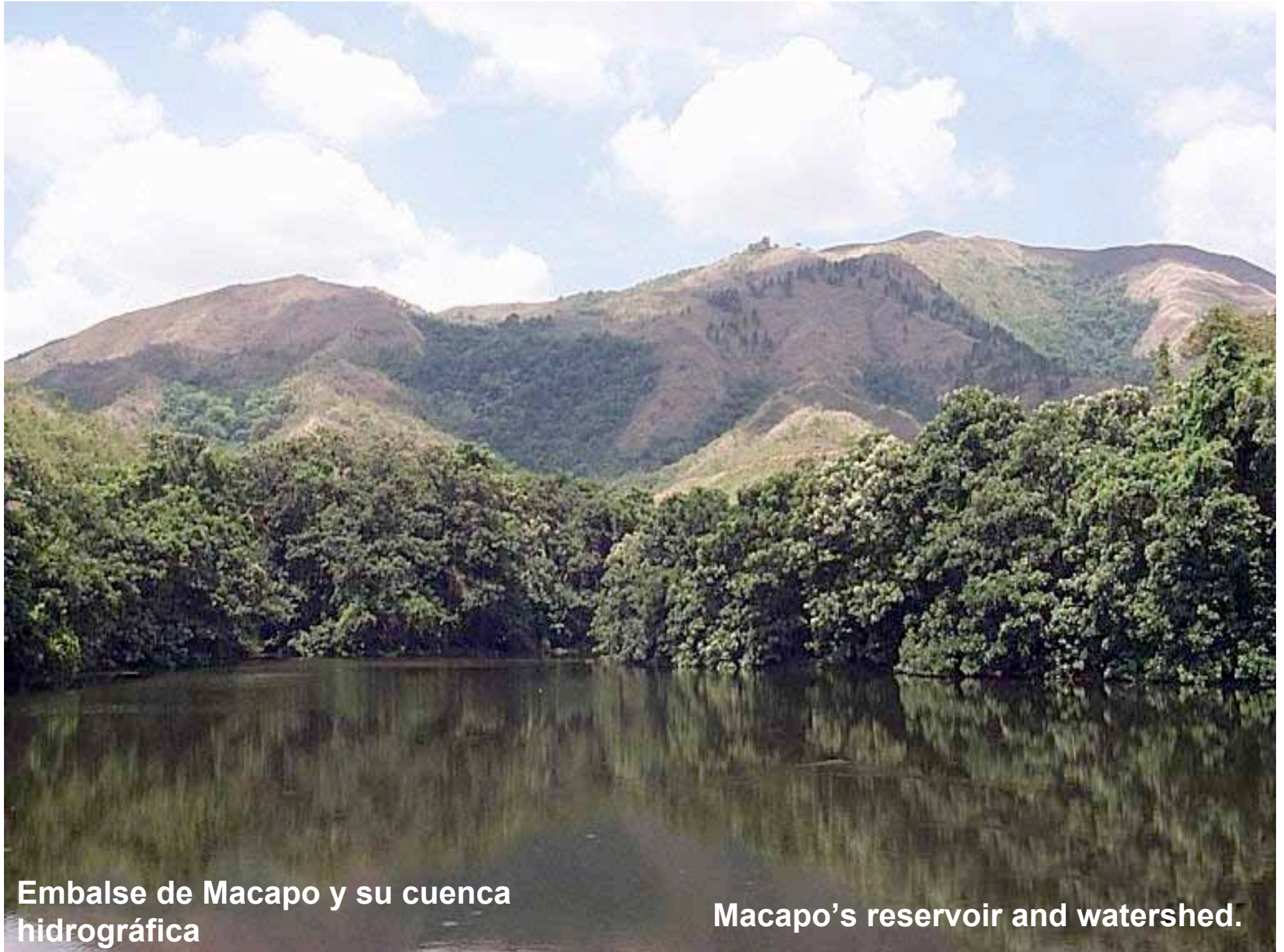
Embalse de Macapo y su cuenca hidrográfrica