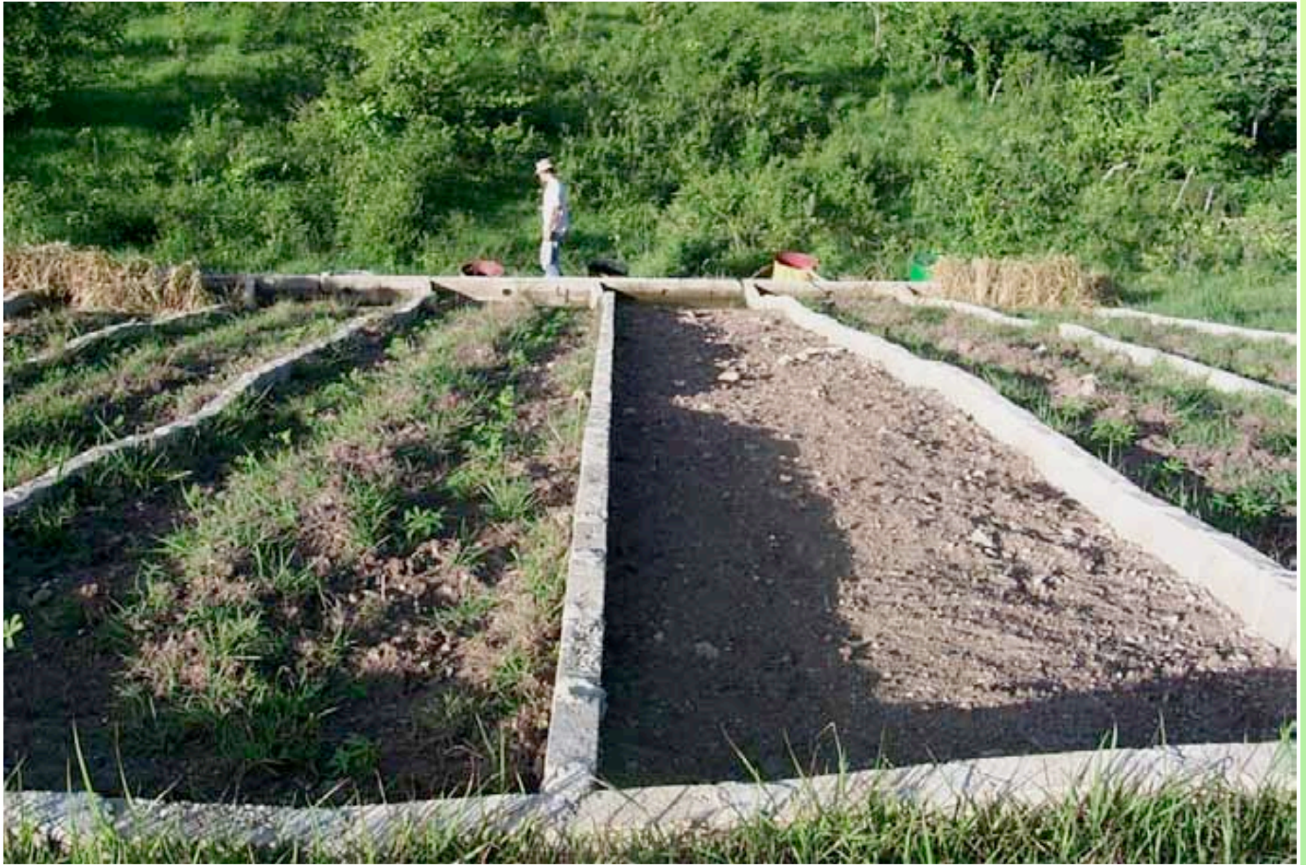
Parcelas de erosión.